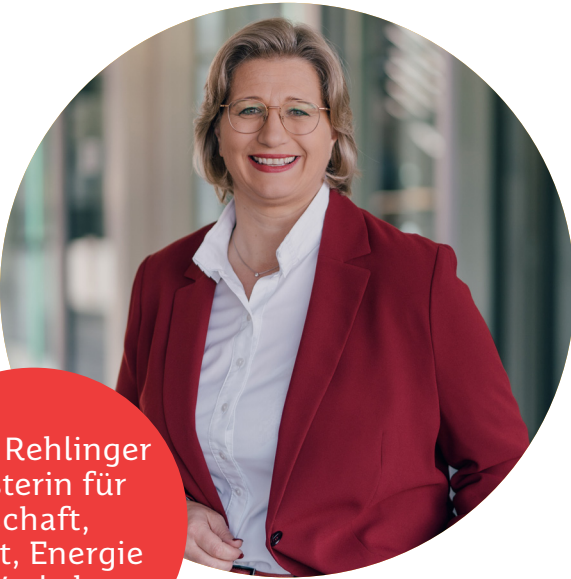
Anke Rehlinger Ministerin für Wirtschaft, Arbeit, Energie und Verkehr

... auf der WBB-Homepage www.weiterbildungsberatung-saar.de